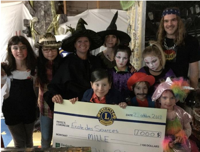
Photo prise lors de la remise d'un don de 1 000 $ par le Club Lions de Saint-Anaclet-de-Lessard au souper de l'Halloween qui s'est tenu le 27 octobre dernier.

Nous tenons à remercier le Club Lions pour sa généreuse contribution.